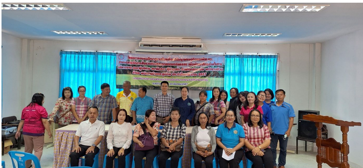
ภาพประกอบรายงาน

ข้าพเจ้าเห็นควรเสนอให้มีการจัดอบรมสัมมนาเชิงปฏิบัติการในหลักสูตรนี้ ซึ่งการอบรมนี้มีประโยชน์มาก และในการอบรมครั้งนี้ผู้บริหารพนักงานส่วนตำบล ได้รับความรู้แนวปรัชญาเศรษฐกิจพอเพียง วัฒนธรรมแห่งการรักษาสีสิ่งแวดล้อมเพิ่มขึ้น ในการบริการสาธารณะ ประเพณี สังคม คุณธรรมจริยธรรม